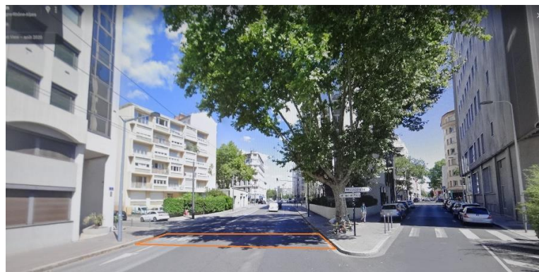
Photo N° 2 – Intersection Emeraudes / Bérenger – Vue vers le nord-est