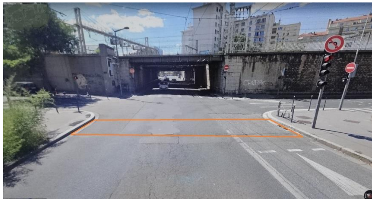
Photo N° 1 - Intersection Emeraudes / Michel Rambaud - Vue vers le sud-ouest