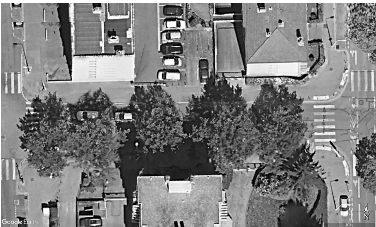
NOTRE PROPOSITION: ELARGISSEMENT DU TROTTOIR IMPAIR