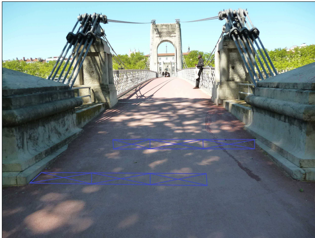
Entrée côté 6ème Adt