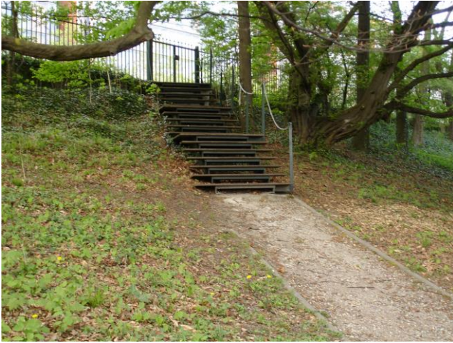
Photo N° 3 Petit escalier en bois menant au portillon de service, fermé