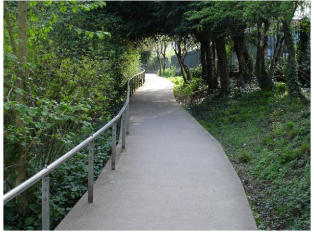
Photo N° 6 Plan incliné menant à la porte du Musée d'Art Contemporain