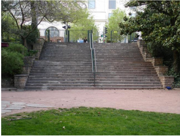
Photo N° 5 Escalier monumental de la porte du Musée d'Art Contemporain