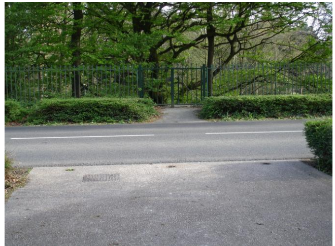
Photo N° 2 Portillon de service dans le prolongement de la passerelle