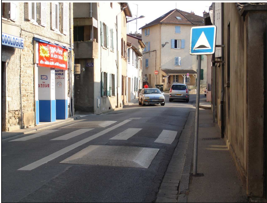
Photo N°4 la Grande Rue, vue vers le Sud, à la hauteur de l'impasse de la Grande Cour. Les coussins "berlinois". Aussitôt franchis, les voitures se relancent. Effet de ralentissement sur 2 X 20 m, au plus. Certains les contournent.