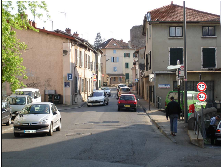
Photo N°2 : la Grande Rue, vue vers le Sud, à la hauteur de la place du Chater. Début de la section critique de 80 m. Etroite, circulation intense. Les piétons n'y sont pas les bienvenus !