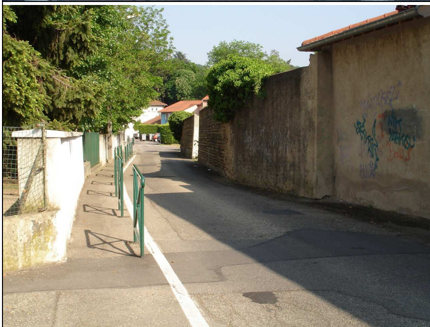
Photo N°6. La rue du Vieux Château, vue vers l'Est en son milieu. En sens unique. Trop étroite pour y dévier l'un des sens de circulation de la Grande Rue.