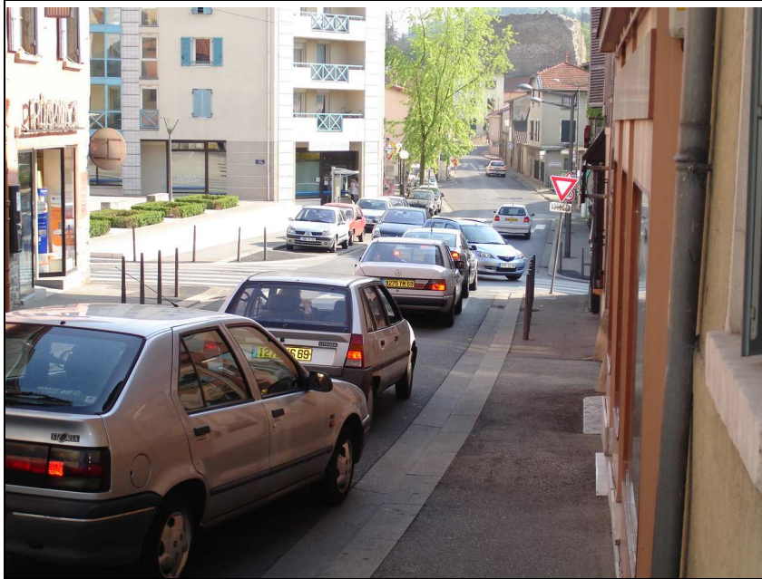
Photo N°1 : la Grande Rue, vue vers le Sud, à l'intersection avec la rue de la Poste. Section en sens unique, avec trottoirs. Circulation intense.