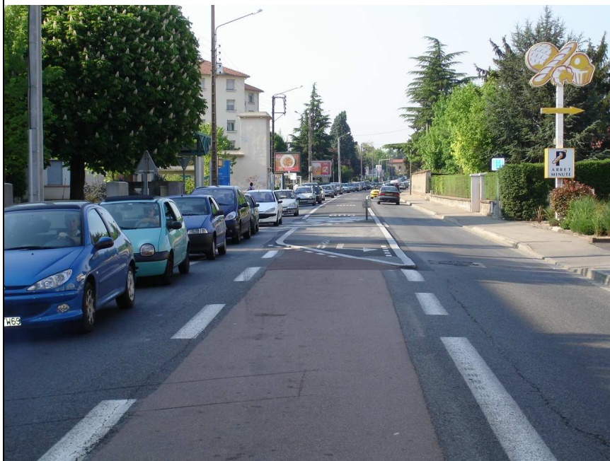
Photo N°5 : l'avenue du Chater, voie de transit. Vue vers le Nord à la hauteur de la Grande Rue. Au centre, le couloir bus.