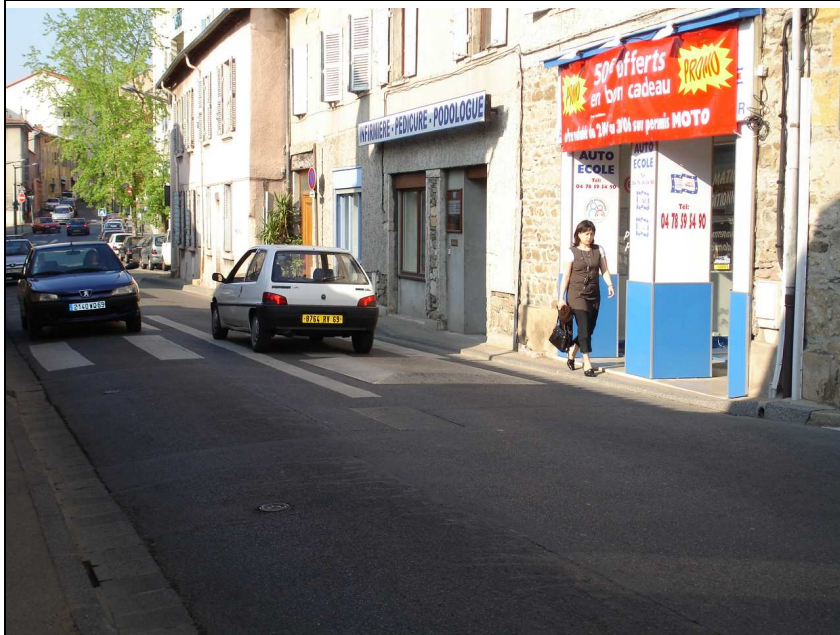
Photo N°3 : la Grande Rue, vue vers le Nord, à la hauteur de l'impasse de la Grande Cour. Les piétons, refoulés par la circulation auto, rasant les murs. Leur croisement est impossible. Poussettes, caddies, enfants et fauteuils roulants sont exclus de fait.