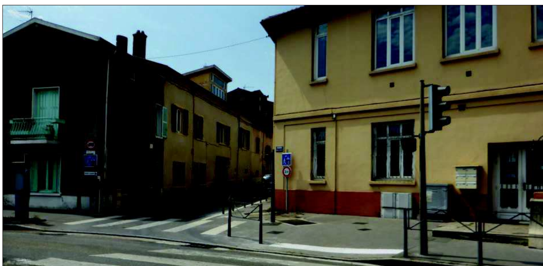
■ Les vétustes bacs à fleurs devant l'école ont déjà été remplacés par des barrières plus sécurisantes.

C'est le nombre de véhicules qui empruntent la rue du Neryard, chaque jour.