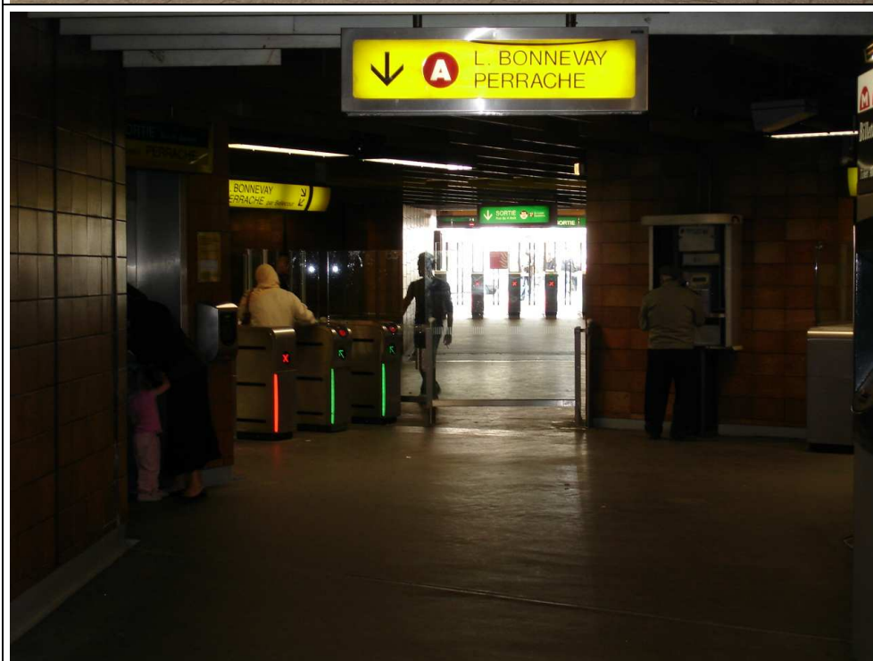
Photo N°2 A l'intérieur du passage il demeure une place suffisante pour déplacer les portillons, de façon à rétablir un passage pour le transit piétonnier public.

Désormais, ce passage est exclusivement réservé aux usagers du métro.